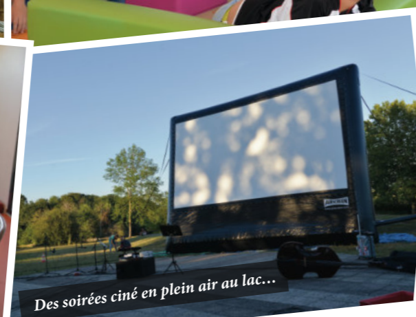
Des soirées ciné en plein air au lac...