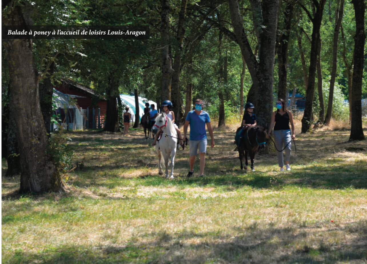
Balade à poney à l'accueil de loisirs Louis-Aragon

Si la pandémie aura eu raison de multiples manifestations estivales comme Chalette fait son festival , toutefois la municipalité et les services municipaux ont tenu à maintenir certaines actions lorsque cela était possible et à organiser, malgré la situation et l'application des protocoles sanitaires, des actions afin que tout un chacun puisse profiter au mieux de cette période estivale singulière. Et c'est un pari réussi si on en croit les retours réalisés auprès des services. Alors merci aux animateurs et aux prestataires qui ont dû imaginer et réinventer d'autres façons d'agir pour un bel été 2020. Retour en images.