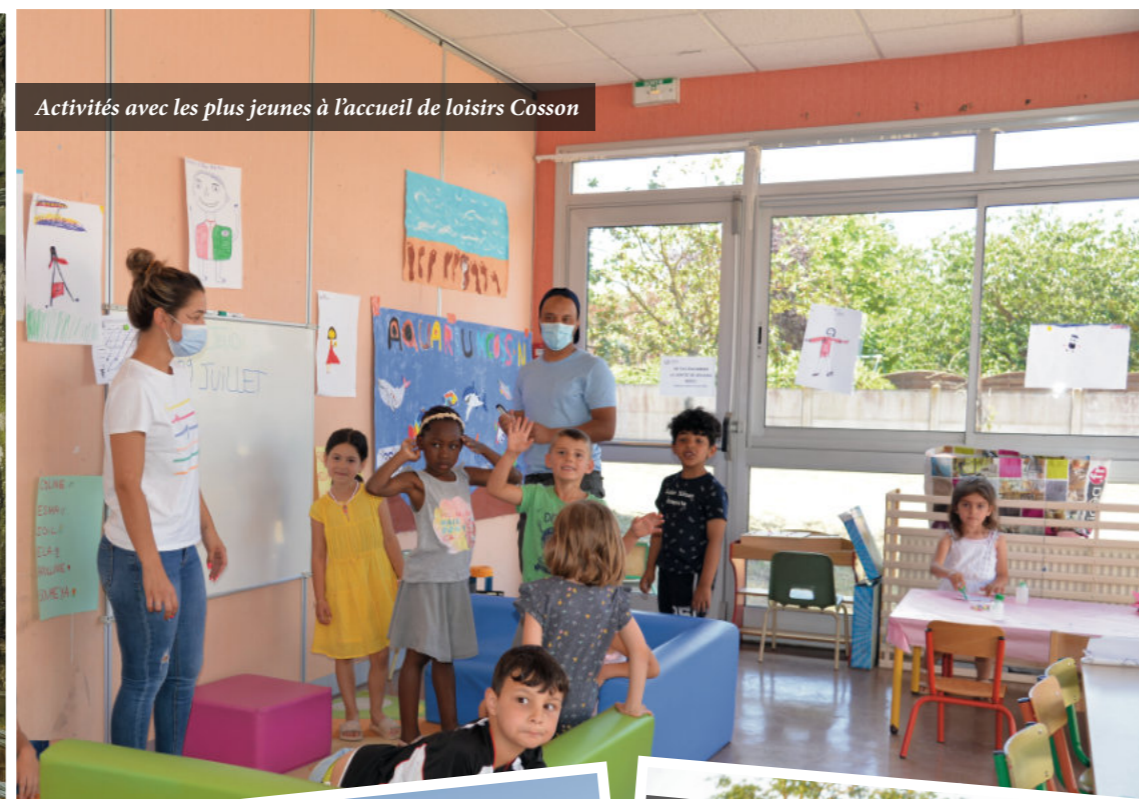
Activités avec les plus jeunes à l'accueil de loisirs Cosson