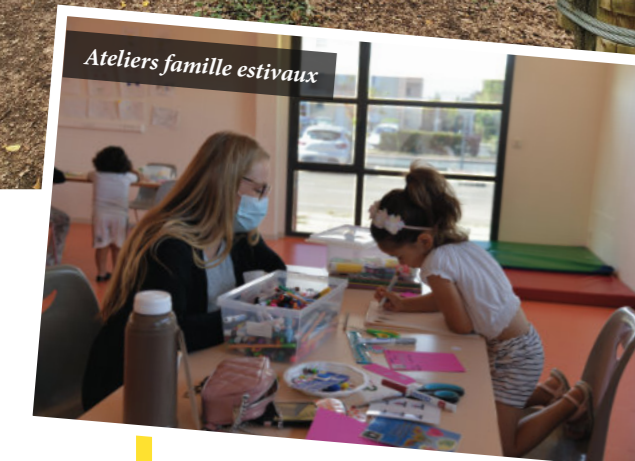
Ateliers famille estivaux