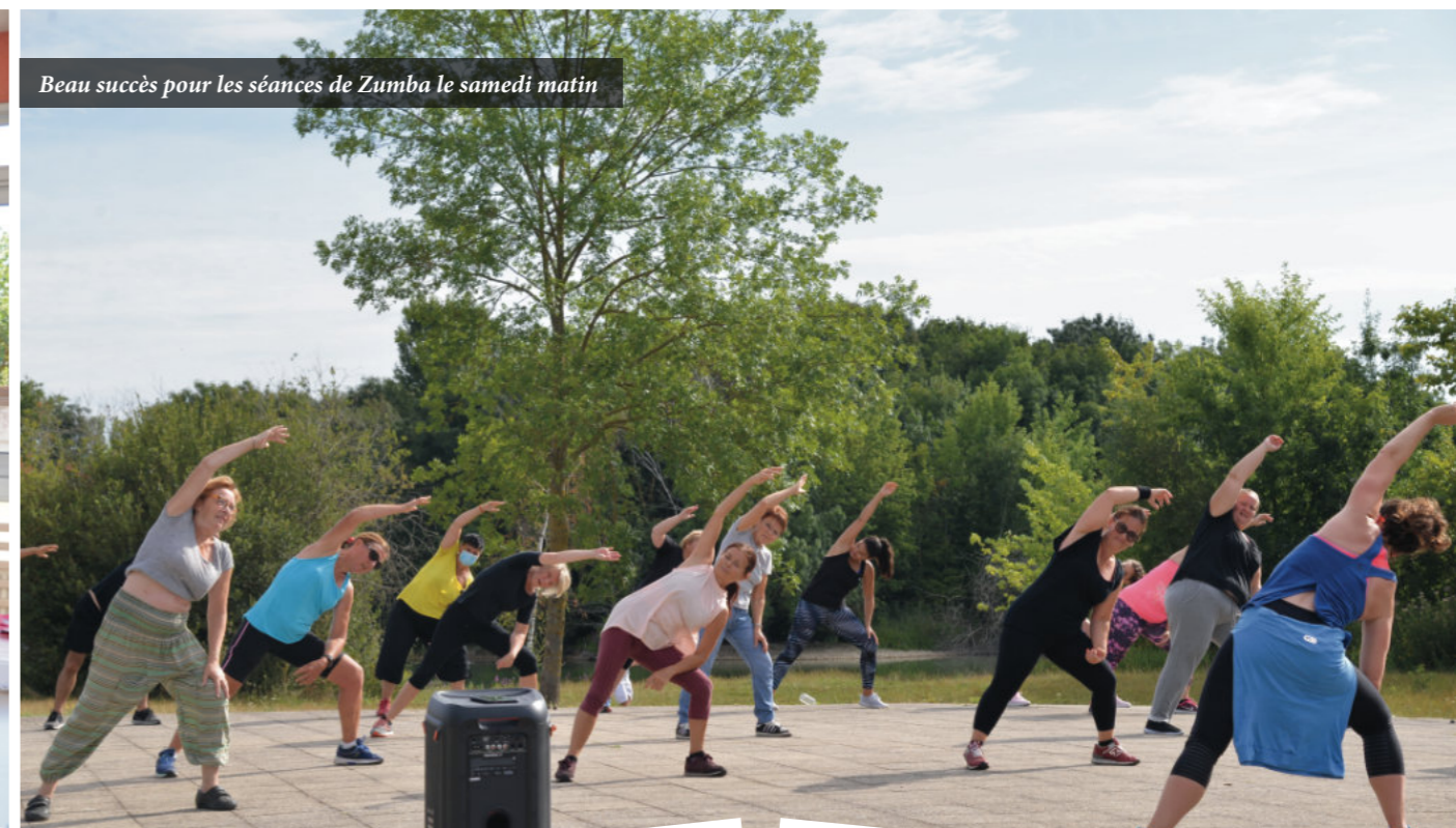
Beau succès pour les séances de Zumba le samedi matin