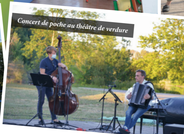
Concert de poche au théâtre de verdure