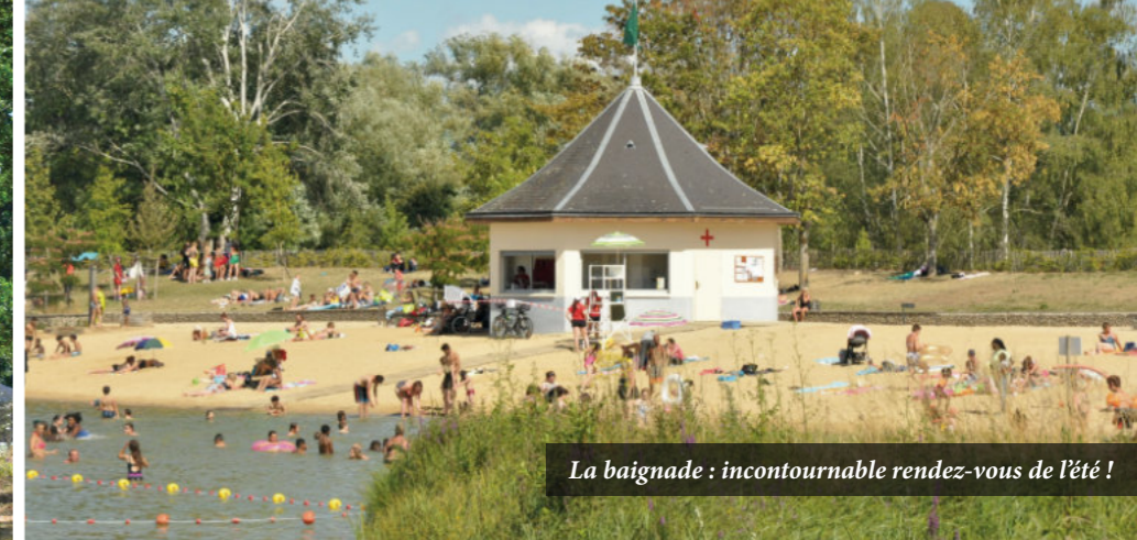
La baignade : incontournable rendez-vous de l'été !