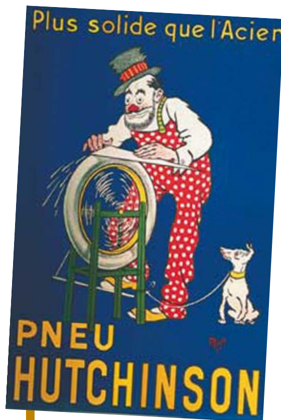
Le célèbre rimeuseur de Mich