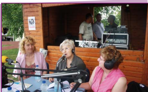
Au centre la défenseuse des enfants lors du débat sur Radio-Chalette