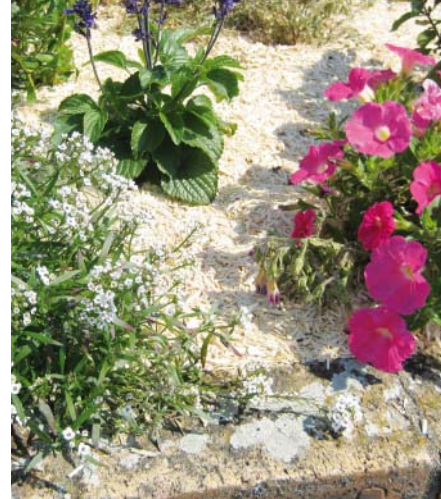
Paillage de chanvre

C'est l'époque des plantations. Les Chalettois ont remarqué que la plupart des massifs de fleurs étaient tapissés d'un revêtement de couleur claire : il s'agit de paille de chanvre.