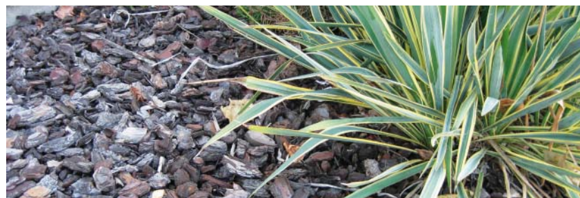
Paillage en écorces de pin

Passage du jury communal les lundi 5 et mardi 6 juillet le matin.