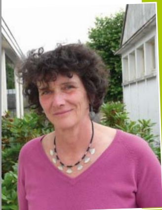
Isabelle Autissier : La navigation reste mon cœur de vie P 8