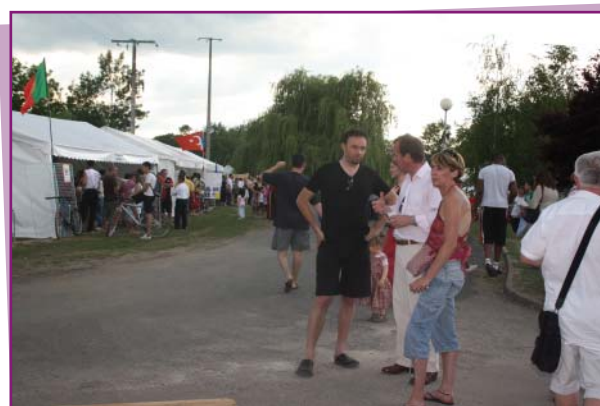
La fête, une occasion de faire des rencontres et d'échanger