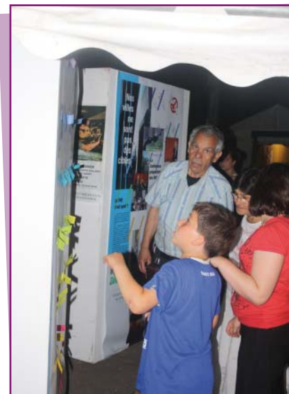
L'exposition "Nos villes ne sont pas des cibles" a retenu l'attention des grands et des petits.

La première édition de la Fête des gamins (4-5-6 juin) a rassemblé plusieurs milliers de visiteurs sur le week-end. C'est toute la ville qui s'est retrouvée au lac pour se distraire, débattre, passer un bon moment entre amis ou en famille dans une ambiance conviviale et festive. Un grand merci à tous les participants, associations, parents d'élèves... qui, aux côtés de la ville, ont permis la réussite de cette Fête. Retour sur quelques moments parmi des dizaines d'autres.