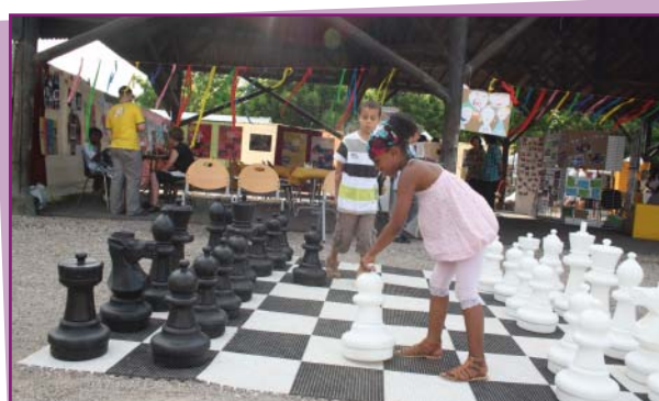
Des enfants lors d'une partie d'échecs