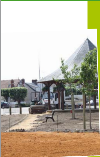
Les travaux dans le Bourg P 3