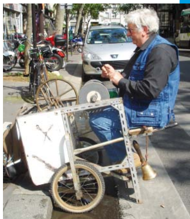
Un des derniers rimeuseurs de Paris.