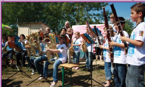
La classe orchestre de l'école Vivier-Boutet lors de l'inauguration