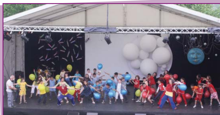
Spectacle pour et créé avec les enfants de Chalette