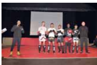
Le Boxing club chalettois