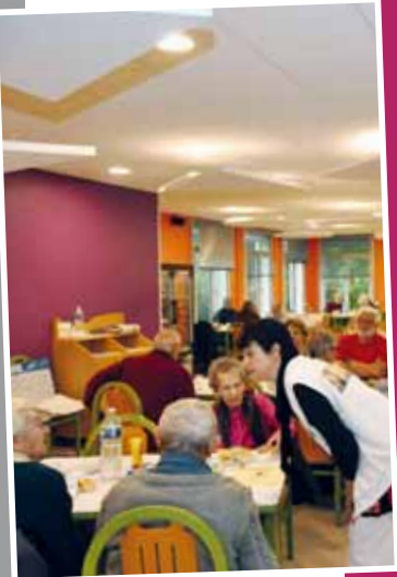
Un nouveau restaurant au foyer Jacques-Duclos