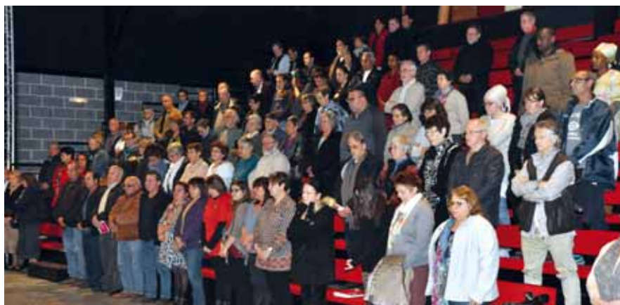
Une minute de silence en hommage aux victimes des attentats

palestinien, a remercié l'assistance de s'être déplacée malgré les circonstances. Il a tenu à remercier tous ceux qui soutiennent son peuple et il a affirmé que c'était de son devoir d'être aujourd'hui solidaire du peuple français : « Nous sommes tous victimes des extrémistes, il ne faut pas leur donner une chance », lançant en guise de message trois mots lourds de sens pour ce Palestinien, Paix, Liberté, Tolérance. Cette intervention a été suivie de deux autres, une de la cellule d'Ibuka du Montargois et une de l'Association des Tunisiens (voir le contenu sur le site de la Ville).