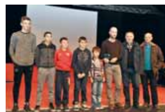
L'école de vélo du Guidon chalettois a été mise à l'honneur