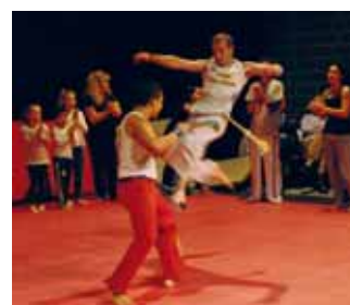
Démonstration du club Falcão Bahia capoeira