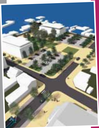
Mercredi 16 décembre, réunion sur les projets d'aménagement du Bourg