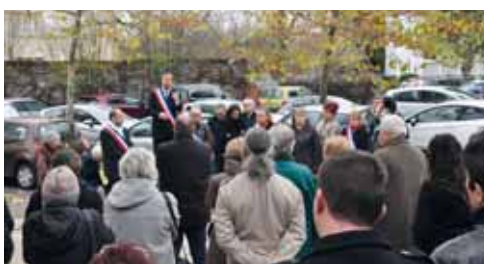
Recueillement sur le parvis de l'Hôtel de ville