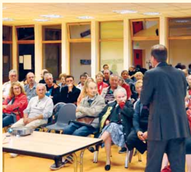
Réunion de présentation de l'étude sur le Bourg le 16 septembre

A l'occasion de cet échange, certains habitants de ce quartier se sont interrogés sur les problèmes de circu-