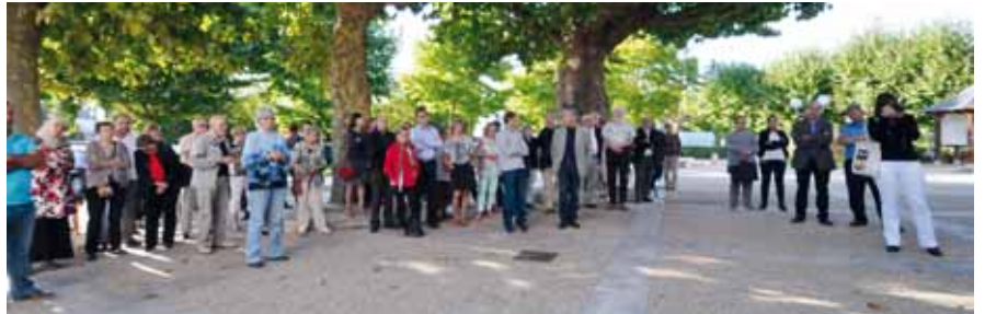
Rassemblement devant la mairie

Mais cette journée ne pouvait pas se dérouler à Chalette sans évoquer la situation des réfugiés. Fidèle à ses valeurs de solidarité, Chalette s'est évidemment déclarée comme Amilly, Villemandeur,