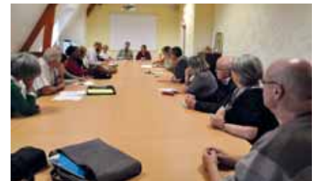
Réunion avec les associations