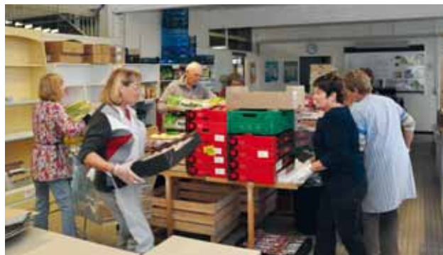
Les bénévoles des Restos

À Chalette, c'est près de 216 familles, représentant 520 personnes, qui ont bénéficié de la solidarité des Restos du cœur durant les 16 semaines de la « campagne hivernale » 2014 - 2015 avec une distribution de 3 400 repas par semaine.