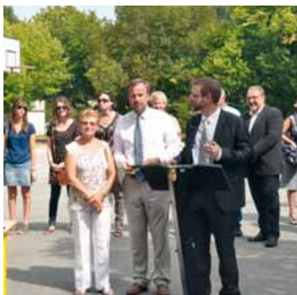
Les autorités accueillent les nouveaux professeurs

Pour le Maire de Chalette, une rentrée scolaire est toujours un enjeu car il faut accueillir, dans les meilleures conditions possibles, les 1700 élèves dans les cinq groupes scolaires. Ceci représente 82 classes (31 en maternelle et 51 en élémentaire) pour une centaine de professeurs des écoles et 31 ATSEM (Agents territoriaux spécialisés des écoles maternelles).