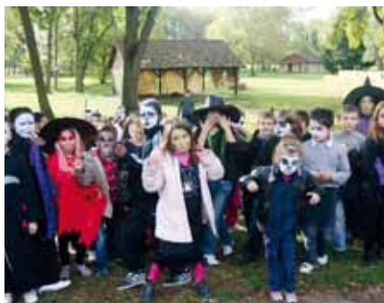
Centre de Loisirs Aragon

Confection de costumes et décors, sorties au bowling, à la piscine, au gymnase et bien d'autres sont au programme. Les enfants plongeront en plein cœur du mystère et de la fantaisie à travers deux grands jeux de fin de semaine sur le thème d'Halloween.