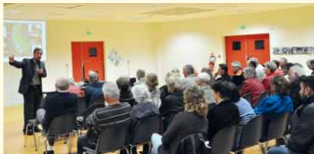
Réunion de présentation de l'étude sur le Bourg le 16 septembre

Ces projets confirment la vitalité de la ville et je m'en félicite.