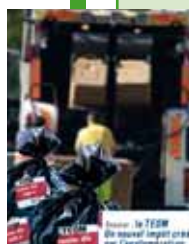
Une du CPC de novembre 2010

Une fois encore, les élus de Chalette, à l'exception de la représentante F.N., se sont prononcés contre cette manœuvre qui vise à augmenter la T.E.O.M. sans en assumer la responsabilité directe. Affaire à suivre.