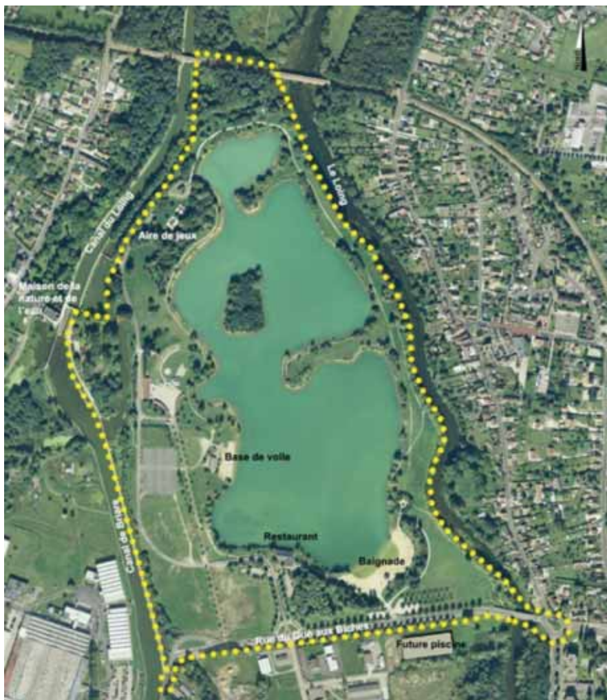
Le périmètre d'intervention

Parallèlement, les habitants ont également été mis à contribution pour faire part de leurs remarques et souhaits : d'une part à travers un questionnaire largement diffusé avec le précédent bulletin municipal, d'autre part par un « atelier urbain », organisé le 24 septembre pour travailler sur les propositions des usagers désireux de participer à la réflexion.