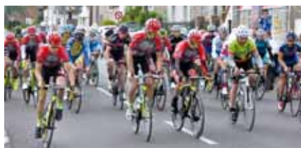
En rouge et noir les coureurs du Guidon chalettois