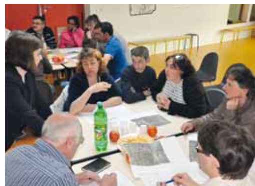
Le premier «Atelier participatif» s'est tenu le 21 mai dernier