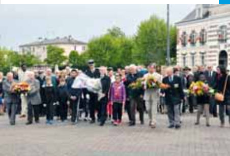
Célébration de la Victoire contre le nazisme, le 8 mai 2015