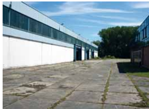
Site de l'ancienne usine Van Leeuwen