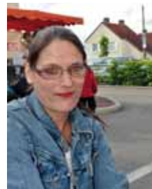
Pour Mme Huerta, la restauration scolaire participe à l'éducation à la préservation de l'environnement