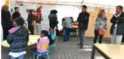
Un forum permanent, ici à Vésines