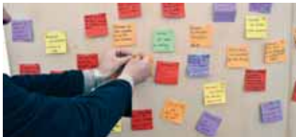
Le mur d'expression