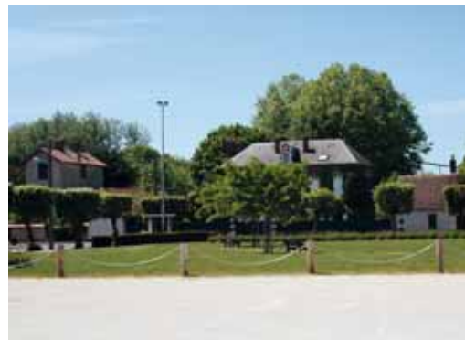
La place Jean-Jaurès