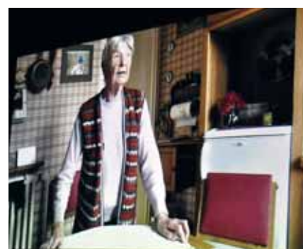
Image extraite du film documentaire

plus âgés - ou même, parfois, les jeunes - évoquent le parcours de leurs parents, racontent les luttes qu'ils ont menées et témoignent du sentiment de solidarité qui les rapprochait. Force est de constater que ce temps, celui des Trente Glorieuses et du plein emploi, est révolu. Tout se passe comme si la mondialisation avait « cassé » la valeur travail. Il ne s'agit pas d'idéaliser une époque prétendument idyllique. Le film montre clairement que le quotidien de nos anciens n'était pas toujours facile, que le travail à l'usine était souvent éprouvant et que s'intégrer n'allait pas de soi. Reste que les luttes sociales donnaient du sens à leurs existences et qu'elles contribuaient à créer du lien entre les différentes communautés en les amenant à coopérer par-delà leurs différences ou préjugés. Or, le contexte social qui rendait possible ces luttes communes s'est effacé dans un monde aujourd'hui dominé par ces hydres tentaculaires et déshumanisées que représentent les firmes transnationales. De tels