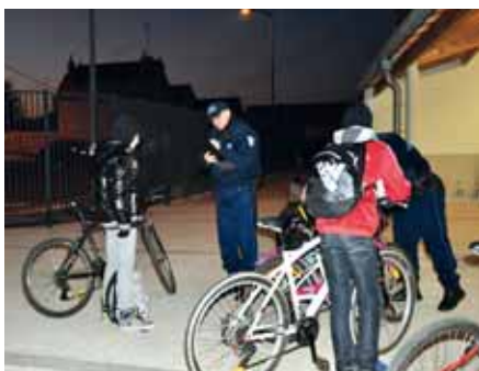
Contrôle de l'éclairage des vélos des collégiens devant le collège Pablo-Picasso