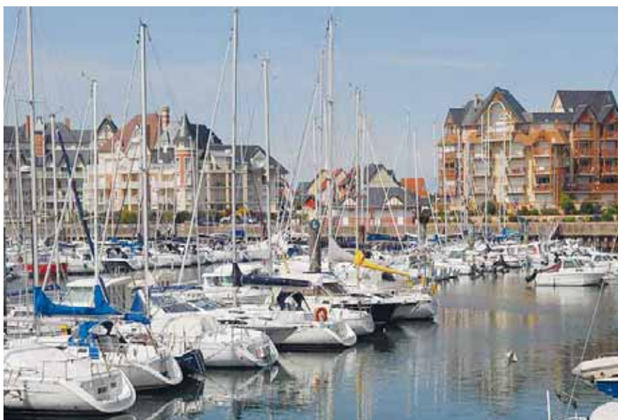
Dives-sur-Mer - Port de plaisance de Port Guillaume