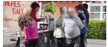
Les visiteurs ont pu goûter aux crêpes élaborées avec des produits issus de l'agriculture biologique