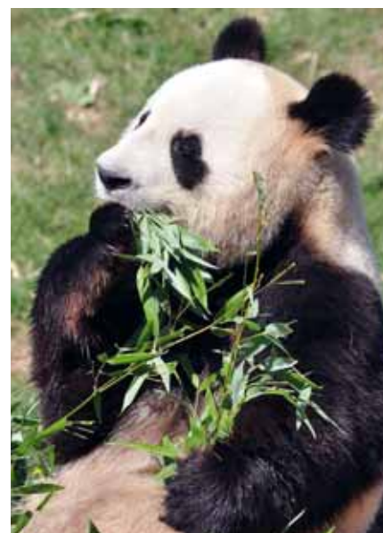
Panda du zoo de Beauval