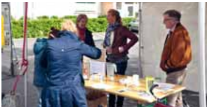
Présentation de produits ménagers écologiques par le CCAS