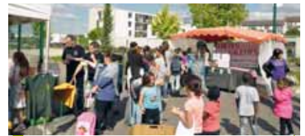
La participation du SMIRTOM a été appréciée, ici près de l'école Pierre-Perret