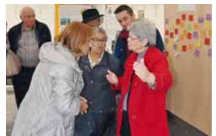
Ici rue Victor-Hugo