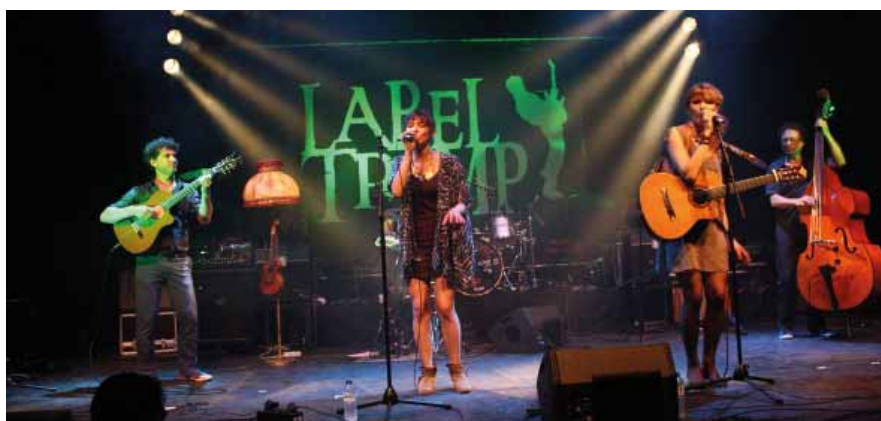
Demain la Veine