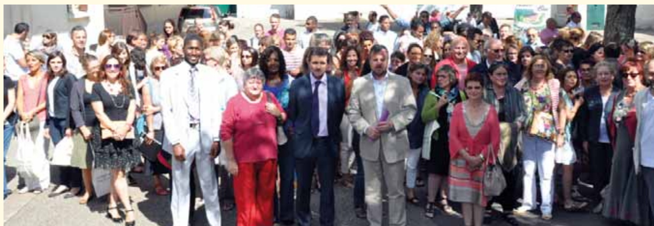
Professeurs, personnel municipal, élus, tous mobilisés pour cette nouvelle rentrée.

alors demandé d'indiquer plusieurs choix et, dans la mesure du possible et dans la limite des places disponibles, ces choix seront respectés.