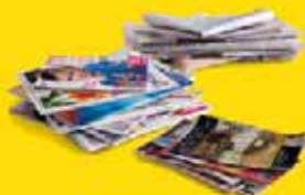
Journaux, magazines, prospectus, enveloppes blanches et les papiers

Le verre se recycle à l'infini, et pourtant encore trop de verre se retrouve dans les Ordures Ménagères !