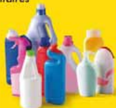
Flacons de produits ménagers et de produits de toilette