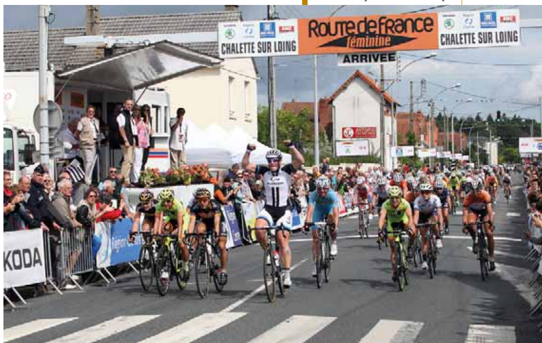
Arrivée au sprint de la 4 ème étape

Retour en images sur l'arrivée de la cette 4 ème étape sur le site Internet de la Ville ville-chalette.fr