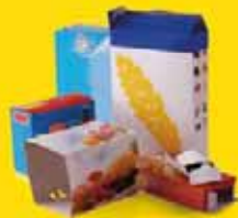
Boîtes et suremballages en carton