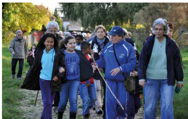
Randonnée intergénérationnelle octobre 2013

Le programme détaillé des Rencontres d'octobre est disponible en Mairie et dans les foyers Jacques-Duclos et Paul-Marlin.