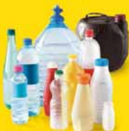
Bouteilles d'eau, de soda, de lait, d'huile, de condiments et les cubitainers