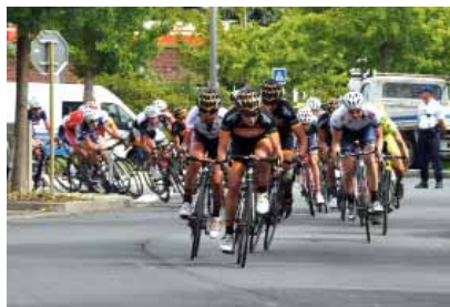
L'entrée sur l'avenue Jean-Jaurès