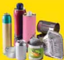
Boîtes de conserve, cannettes, les aérosols et les bidons