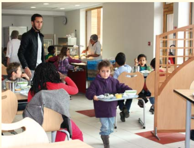
Le self, école du Bourg