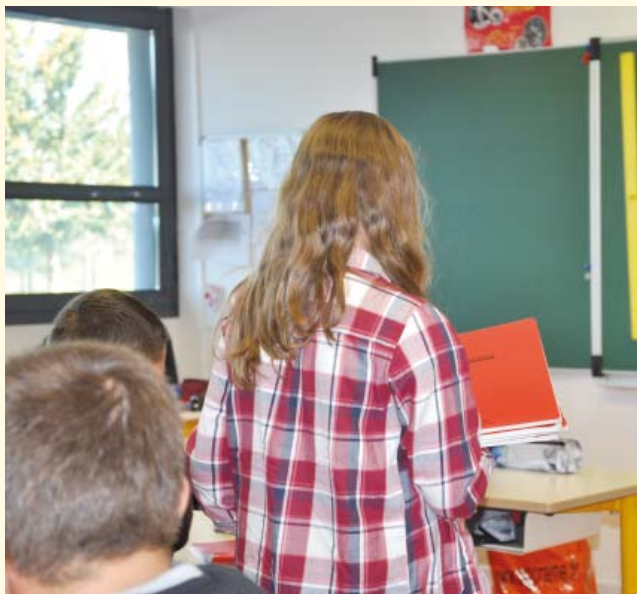
Elémentaire Pierre-Perret, distribution des cahiers