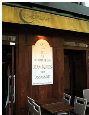
Le Café du Croissant

Il y a 154 ans, le 3 septembre 1859 naît à Castres Jean Jaurès. Quelques années plus tard, en 1885, il est élu député du Tarn du centre gauche et à ce titre, en 1892, il est appelé au secours des mineurs de Carmaux en grève pour défendre l'un des leurs, licencié après avoir été élu maire de la ville. Cette lutte le marque profondément ; il y découvre la lutte des classes et acquiert de profondes convictions. Il prendra également, après avoir hésité un temps, la défense d'Alfred Dreyfus en éditant les preuves de son innocence. Homme de très grande culture, helléniste (1) et germanophone, Jean Jaurès est également un tribun hors pair auquel s'ajoutent les qualités d'humaniste, d'abolitionniste convaincu et de pacifiste. Il se bat contre la loi des trois ans (trois ans de service militaire) et milite contre l'impérialisme français qui, ne se différenciant pas de la politique allemande de l'époque, participe d'un dangereux engrenage qui met la paix de l'Europe en danger. Il devient dès lors l'homme à abattre pour les nationalistes. Farouche partisan de l'unité socialiste, il est l'un des principaux artisans de la fusion des différentes sensibilités de gauche au sein de la S.F.I.O. (section française de l'Internationale ouvrière) et du journal l'Humanité (2) qu'il fonde le 18 avril 1904. Dans le même esprit, il milite pour un dialogue entre les partis et les syndicats. Anticolonialiste, pacifiste, il s'insurge contre l'entrée en guerre de la France en 1914.