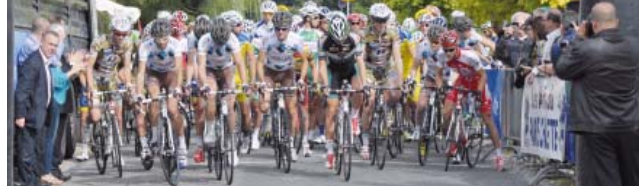
Départ de la course Paris Chalette Vierzon le 21 septembre 2013