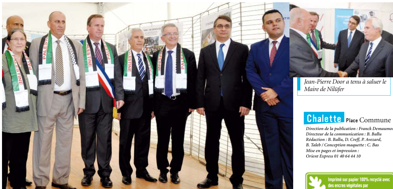
Les représentants de Nilüfer et d'Askar en présence du Maire de Chalette et de François Bonneau, Président du Conseil Régional

précisé que ces signatures marquent le début d'échanges fructueux tant au niveau social, culturel, sportif, qu'environnemental. Apprendre à mieux se connaître et développer des projets communs, tels sont les objectifs. Les représentants des deux villes désormais jumelles ont également apporté aux Chalettois toute la solidarité et la sympathie de leur peuple respectif. Ils ont tous deux souligné leur satisfaction de pouvoir échanger avec Chalette, ville de Paix qui a su accueillir tout au long de son histoire quantité de nationalités diverses et créer les conditions pour que toutes puissent bien vivre ensemble.