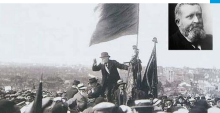
Jean Jaurès au Pré Saint-Gervais

Rares sont les communes françaises qui n'ont pas une place, une rue, une école qui porte le nom de Jean Jaurès. Chalette ne déroge pas à cette pratique puisqu'une place et une avenue lui sont dédiées. Un café porte également son nom et, ironie du sort, c'est à la table d'un bistro que sa vie se terminera tragiquement. Retour sur le parcours de cet homme politique dont le nom, plus de 150 ans après sa naissance, surgit toujours au détour des discours de responsables politiques de gauche comme de droite.