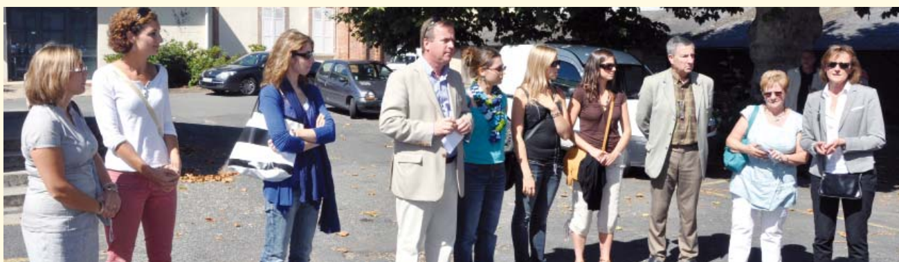
La Municipalité souhaite la bienvenue aux nouvelles professeures des écoles

sieurs étapes sont prévues : la Ville commencera tout d'abord à réfléchir avant la Toussaint, en concertation avec la communauté éducative, sur les contenus à mettre en place. Dans un deuxième temps, il s'agira de trouver un consensus sur les horaires en déterminant les temps d'apprentissage mais aussi des activités pédagogiques complémentaires (A.P.C.) correspondant à l'aide personnalisée des enseignants, ou encore le temps périscolaire éducatif (T.P.E.) mis en place par la Ville et les associations. L'objectif de ces échanges entre la collectivité, les enseignants et les parents d'élèves dans les mois à venir est de s'accorder sur un dispositif partagé tant sur les contenus que sur les horaires.