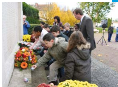
Cérémonie du 11 novembre 2008