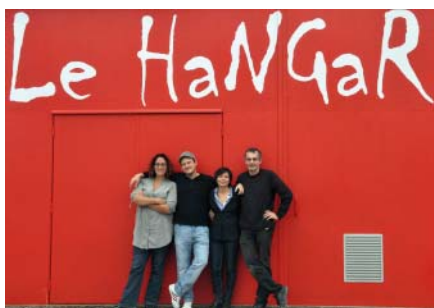
L'équipe du Service culturel.