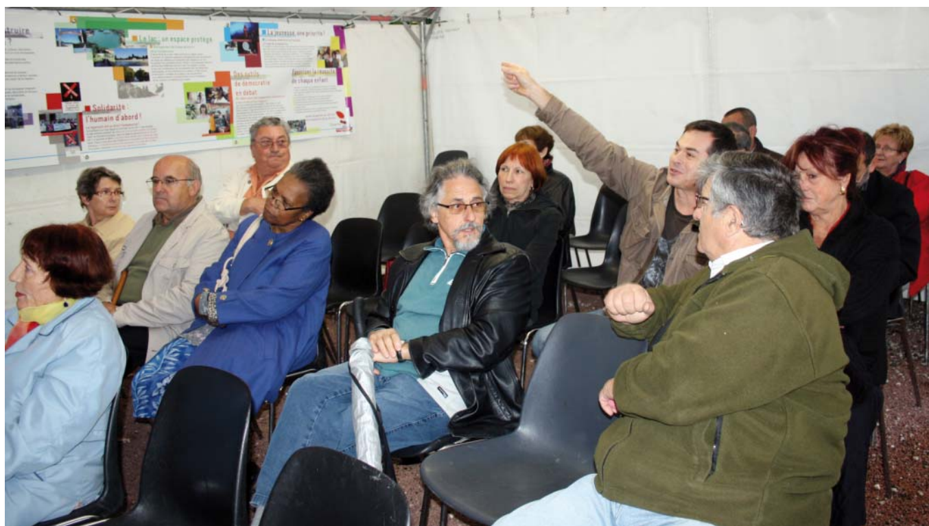
La participation citoyenne, signe d'une vitalité démocratique.