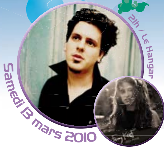
21h / Le Hangar