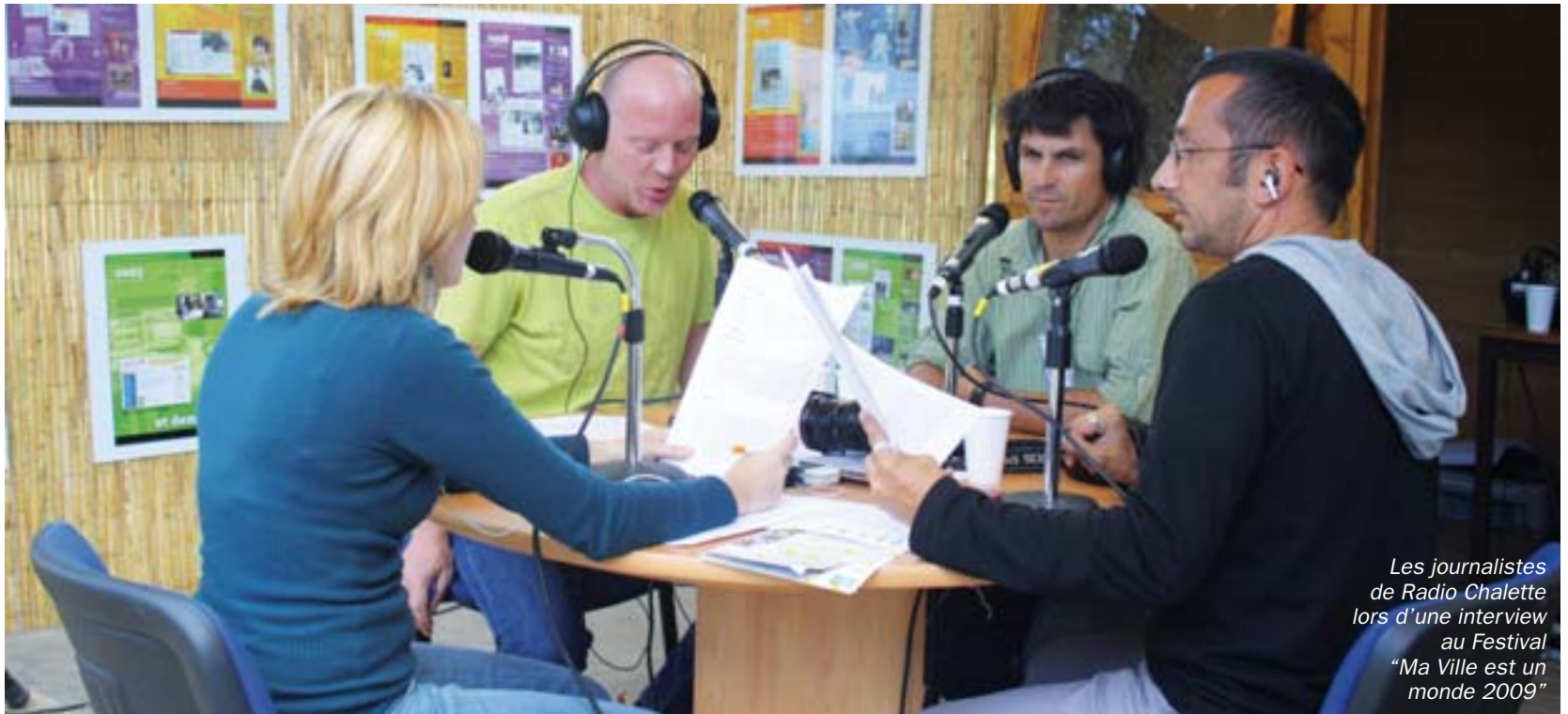
Les journalistes de Radio Chalette lors d'une interview au Festival "Ma Ville est un monde 2009"

Fruit d'une réflexion entamée, il y a plusieurs mois, la municipalité s'est dotée depuis quelques jours d'un véritable pôle de communication regroupant l'ensemble des supports de communication de la ville et Radio Chalette.