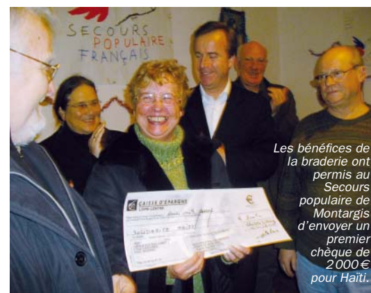
Les bénéfices de la braderie ont permis au Secours populaire de Montargis d'envoyer un premier chèque de 2000€ pour Haïti.

tion de cette soirée, contacter le service culturel au 02.38.07.24.95.