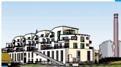
Esquisse du projet de réaménagement