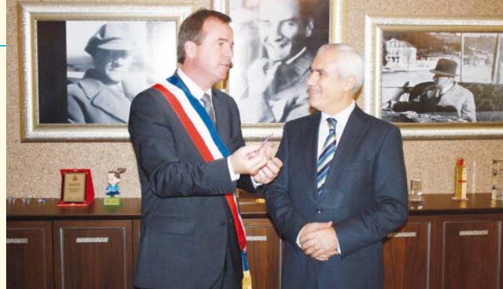
Rencontre entre les maires de Nilüfer et de Chalette

Chalette, ville engagée dans la solidarité et la culture de paix, est en effet jumelée avec le quartier de Dnieprovski de Kiev (Ukraine) et Ponte de Lima (Portugal). Elle a également développé des liens d'amitié avec la ville de San Antonio de los Baños à Cuba. Enfin un projet dans le domaine de l'éducation avec la ville de Pout au Sénégal a été réalisé avec le Service Jeunesse de la Ville.