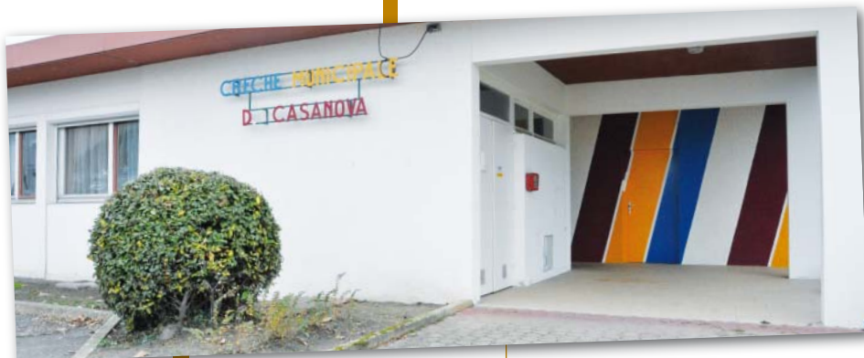
La crèche municipale de Chalette

Héroïne de la résistance , de nombreuses rues et écoles, des collèges et des lycées ont été baptisés de son nom après la Libération, notamment à Paris. Son nom fut également donné à deux navires de la S.N.C.M.