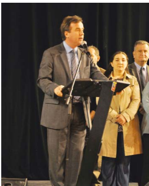
Le Maire à la cérémonie des vœux à la population, lors de son allocution le samedi 21 janvier 2012

Comme maire de Chalette, commune où les habitants sont déjà frappés de plein fouet par le chômage, la précarité et les bas salaires, je m'oppose radicalement à cette politique d'austérité qui leur enfonce encore plus la tête sous l'eau.