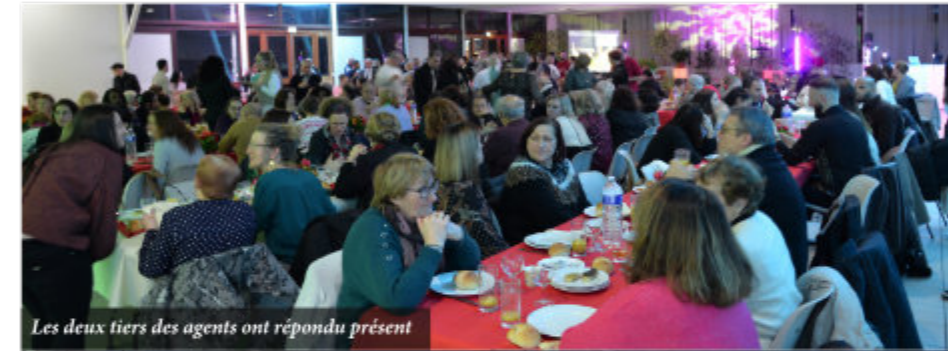
Les deux tiers des agents ont répondu présent