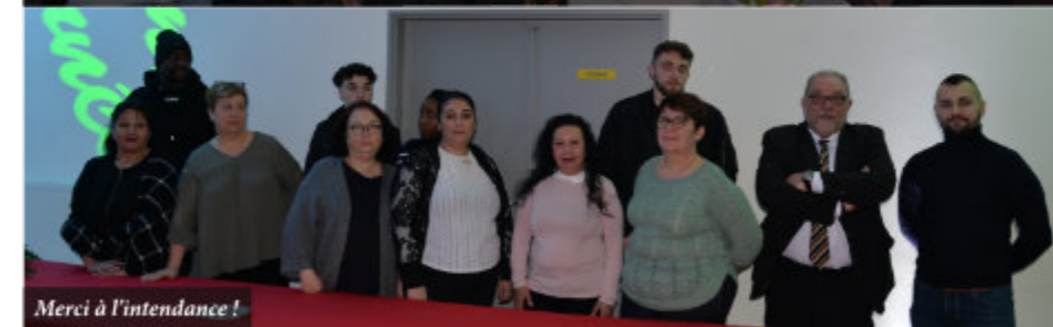
Merci à l'intendance !