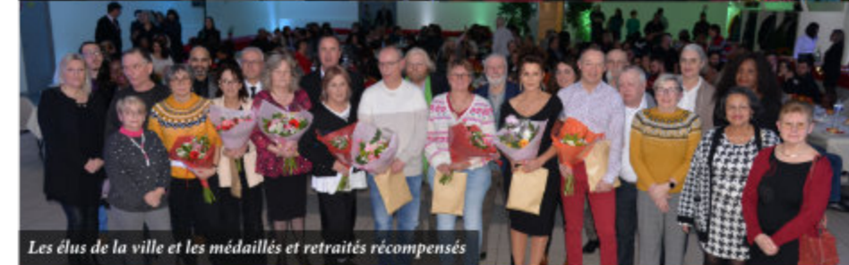
Les élus de la ville et les médaillés et retraités récompensés