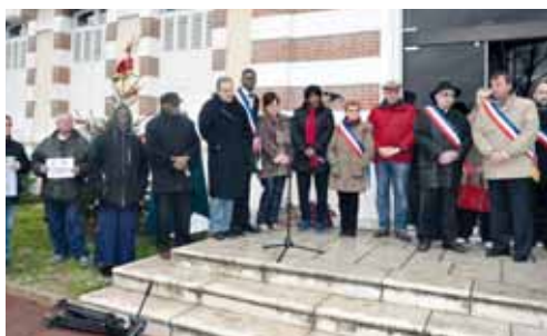
Les élus et des représentants d'associations unis pour rendre hommage aux 17 victimes du 17 janvier devant l'hôtel de Ville