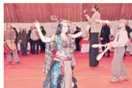
Les Croqueurs de pavés ont animé la soirée avec leur nouveau spectacle