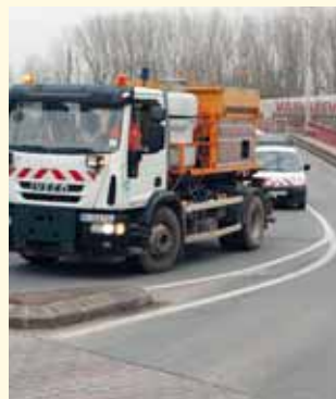
La sableuse dans le convoi en direction de la Sous-préfecture