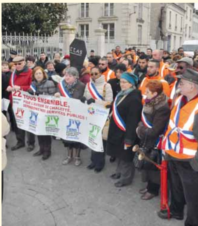
Personnel municipal et élus devant la Sous-préfecture pour dénoncer l'austérité imposée aux communes