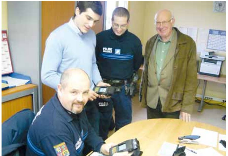
Formation des agents au nouveau système de verbalisation électronique

L'appareil, en service depuis déjà cinq ans dans l'Hexagone et déjà utilisé par les gendarmes et la police nationale, se présente sous la forme d'un boîtier, le P.D.A. (personal digital assistant). Lorsque l'agent de police muni de son boîtier et d'une carte codée individuelle qui l'identifie constate une infraction, il enregistre tous les renseignements utiles (type d'infraction, numéro d'immatriculation du véhicule, nom du conducteur, lieu de l'infraction...) dans l'appareil. Le P.D.A. étant muni d'un appareil photo, l'agent prend également deux clichés, lesquels pourront, le cas échéant, appuyer l'infraction et servir de preuve pour toute réclamation.