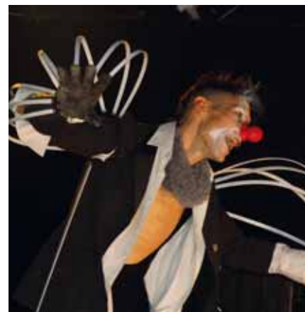
Big caddy était présent aux 10 ans des Croqueurs