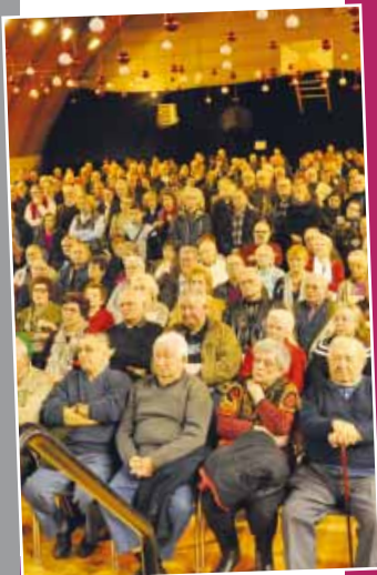
Les Voeux à la population P.6