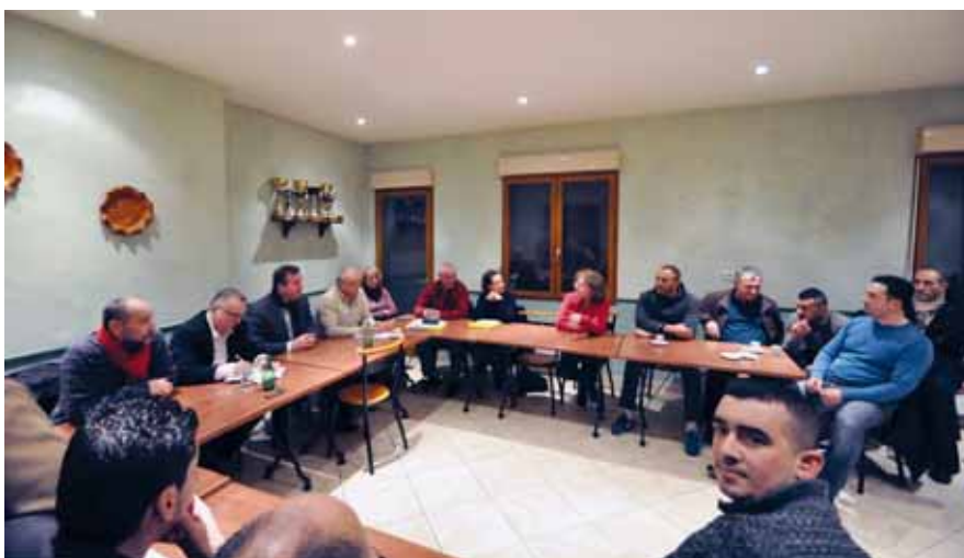
Réunion de présentation des futurs travaux de la rue Joliot-Curie

Car l'enjeu est là, maintenir et développer une activité commerciale et de service au cœur de Vésines à l'heure d'une désertification des commerces de centre-ville au profit