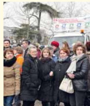
Le personnel municipal, présent aux côtés des élus