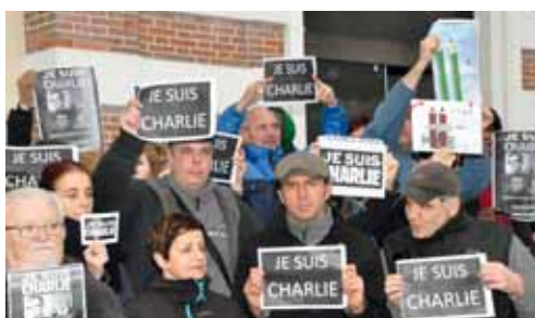
Tristesse et détermination se lisaient sur tous les visages