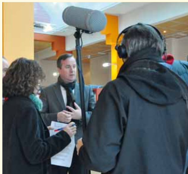
Interview du Maire par France 3 Orléans