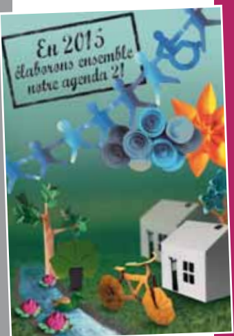
Lancement des concertations relatives à l'Agenda 21 P.7